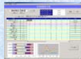
日別時間別予測画面