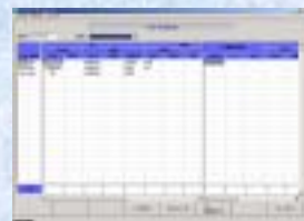
日別予算入力画面