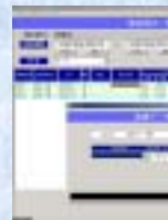
勤怠修正一覧画面